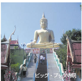
ビッグ・ブダ寺院

も楽しめ ます。サムイ 島には数 多くの美 しいビー チが点在 しており、 なかでも 東岸のチャウエン・ビーチがいちばん 賑やかで、たくさんのホテルやコテージが建ち並んでいます。ほかにも島の 北部にメナムやポ・ブット、北東部に チョン・モン、東南部にラマイなどの ビーチがあり、シュノーケリングや ウィンドサーフィン、パラセーリング などのマリンスポーツが楽しめます。 また、ダイビングツアーを利用する場 合は、日本人インストラクターが常駐 するダイブショップもあり、便利です。 この島ではマリンスポーツ以外に も、いろいろな楽しみを見つかること ができます。例えば、北部で陸続きに なっているファン島のビッグ・ブッタ 寺院(ワット・プラ・ヤイ)では高さ12 mの黄金色に輝く大仏が、そして、自然 の造形美が見事なラマイ・ビーチの南 側ではたくさんの奇石が見られます。 また、島内にあるいくつもの滝も見 どころのひとつで、島の中央南部のナ ムアン滝近くにはエレファント・ト レッキングが楽しめる所もあります。 さらに、モンキー・センターでは、サ ルのヤシの美姿をこよひと見られます。 ゴルフを楽しむ人々には、2003年11月に島の北部にオープンした サンティプリ・ゴルフクラブのSantipri Golf Club 66-77-4255・5622 www.santipri.com/英語があります。