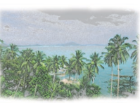
Travel Guide 旅先案内 Surat Thani

スラタニ市の北約12.4 kmに広がる国立公園です。園内にそびえるソック山の熱帯雨林は、1億6000万年前の生態系が残る森林です。 8時～18時 200 B 66-77-3955・1555