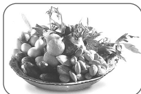
Amazing Taste! Thai Southern Foods

また、南部には、昔から中国系の人々が住む地域やイスラム教徒であるマレー系の人々が多く住む地域などがあり、それぞれの独自の文化が残っていたり、融合したりしているのが大きな特長です。