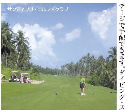
サンティプリ・ゴルフ・クラブ

スラタニ市から南へ7 kmほど北にあるチャイヤの町からさらに7 kmほど北にある寺院。1959年にタイの有名な僧侶によって建てられ、自然に包まれた森林寺院として知られています。毎月1日から10日の4時から21時まで、外国人のための瞑想が行われており、前月末日の登録に間に合うように寺院を訪ねれば、誰でも瞑想に参加できます。料金は食事込みで、10日間1500 B。 6時～18時 無料 66-77-4311・5222 www.suanokkong.org (英語)