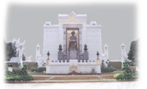
Recommended Tour from TAT TAT オススメの旅 Rattanakosin Island

タイの首都バンコクを、タイの人々は「クルンテープ」と呼びます。実は、バンコクの正式名称は「クルンテープ・マハーナコーン・アマローン・ラタナコシン……」から始まる世界一長い名前です。この名の一節に出てくる「ラタナコシン」とは「エメラルド仏陀が安置されている所」という意味で、バンコクの一部、ラタナコシン島の地名の由来となっています。 ラタナコシン島は、西をタイの母なる川チャオプラヤー川、東をオン・アー運河およびバンランブー運河に囲まれたバンコクの中心部で、バンコク発祥の地です。 1782年、短命だったトンブリ王朝が終焉を迎えると、最高司令官であったソムデット・チャオプラヤー・マハー・ガサックは、現チャクリー王朝の初代王ラーマ1世(在位1782~1809)となり、それまでチャオプラヤー川西岸(現在のトンブリ地区)にあった首都を対岸に移します。蛇行するチャオプラヤー川の湾曲部に川の上流と下流を繋ぐ形でオン・アー運河とバンランブー運河を掘って中の島を造り、新しい首都としました。それがラタナコシン島で、ラーマ1世はここに王宮とエメラルド仏を祀るための寺院、ワット・プラケオを建設しました。現在も、ラタナコシン島には主要な寺院や各省庁、大学、博物館などが点在し、まさにバンコクの政治、文化、宗教、学問の中