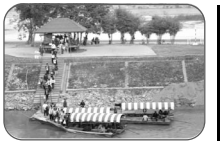
Mu Trip to Thailand タイ旅行体験記