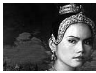
See More Thailand ちっと道草 Thai Heroines

明してくる。早口でさっぱりわからなかったが、あのスイカのジュースはとてつもなくおいしかった。別れ際にそのお礼をいうと、こりこりと微笑んでくれた顔が、なんと愛嬌がある。その土地の人々との小さな触れ合いが、旅の思い出を濃くしてくれる。早朝散歩の途中、一軒の小さな店が開いていたので寄ってみた。初老のおじさんが何やら玩具らしい物を丹精込めて作っている。手のひらに乗るくらいのカラフルな小鳥で、その尾に本物の鳥